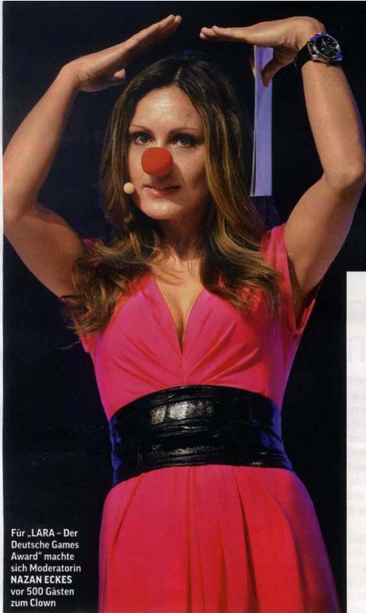
Für „LARA – Der Deutsche Games Award“ machte sich Moderatorin NAZAN ECKES vor 500 Gästen zum Clown