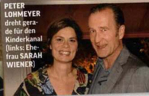
PETER LOHMEYER dreht gerade für den Kinderkanal (links: Ehefrau SARAH WIENER )