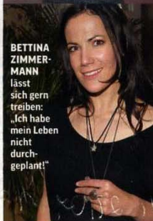
BETTINA ZIMMERMANN lässt sich gern treiben: „Ich habe mein Leben nicht durchgeplant!“