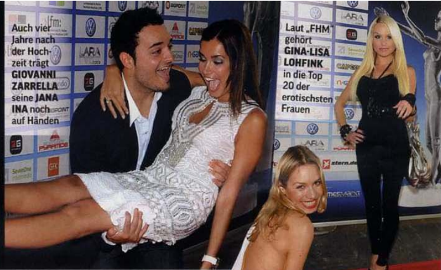
Auch vier Jahre nach der Hochzeit trägt GIOVANNI ZARRELLA seine JANA INA noch SPONTAN auf Händen