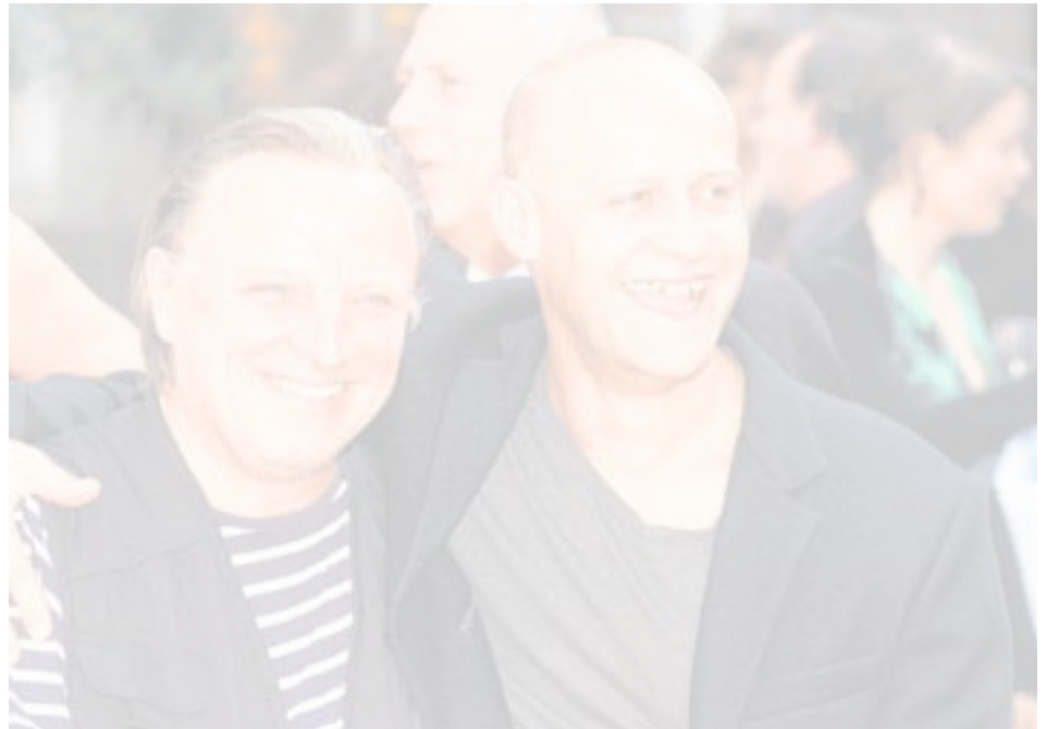
Amüsierten sie in der Wolkenburg: Jürgen Vogel und Schauspielerkollege Axel Prahl.