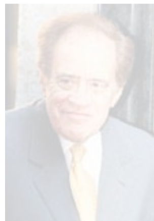
Produzent Arthur Cohn hat schon sechs Oscars bekommen.