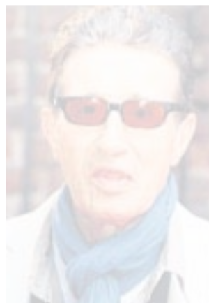
Cool mit Sonnenbrille im Blitzlichtgewitter: Rolf Zacher