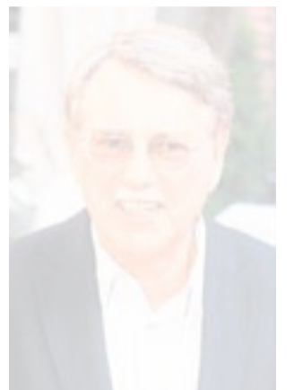
Erfahren auch auf dem roten Teppich Regisseur Heinrich Breloer.