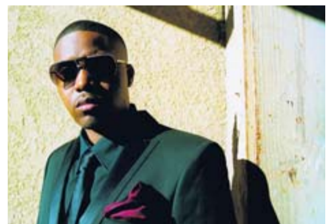
US-Rapper Nas ist einer der großen Stars in der Hip-Hop-Szene. Am Samstagabend tritt er am Fühlinger See auf.

Nas: Das Afrika, das wir meinen, hat eine große kulturelle Geschichte und wichtige Dinge zur Welt beigetragen. Unsere Botschaft lautet: Niemand steht alleine da. Wir ziehen Verbindungslinien von Jamaika in die USA und zwischen den Afrikanern, die überall in der Welt verteilt leben. Diese Botschaft steckt